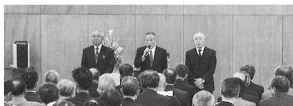
退任役員のみなさん