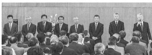
新任役員のみなさん