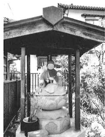
庵創建以前から安置されている親子像台座、建物は江戸時代以前の物か。