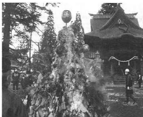
中村区のどんど焼き (1/10)