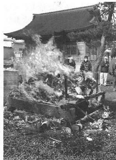
東和田区のお焚き上げ (1/10)