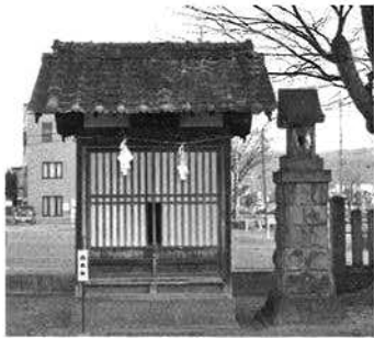
右側が養蚕大神で明治27年安達神社境内に村で建立した。 (左側 白鳥社)

す。棒付きを与える頃は居間・茶の間・座敷の畳を上げて蚕に占領され、寝る場所は物置・土蔵に移りました。夕方や学校が休みの日は、びく一杯に葉を取り、時には小さな指に葉を採る鎌を付け、棒付きの桑は厚刃鎌で切取りリヤカーに乗せて、子供はその後押しをして帰りました。「八幡隅が暗くなると雨になる」と言われ急いで帰った事も。雨で濡れた桑棒は物置で乾かしてから蚕に与えました。蚕が桑の葉を食べている時の音は、今でも懐かしく聴こえてきます。