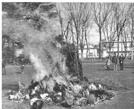
五分一区のどんど焼き (1/10)

新型コロナの関係で恒例の「どんど焼き」は、感染拡大防止の観点から規模を縮小して行われたり、「どんど焼き」を中止して区役員による「お焚きあげ」で松飾りなどを焚きました。