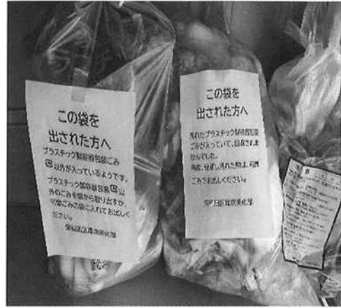
汚れたプラ容器・プラゴミ以外が混在