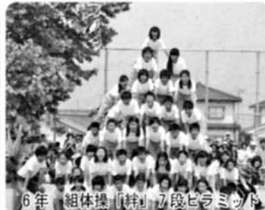
6年 組体操「絆」7段ピラミッド