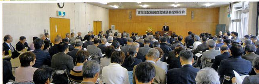
古牧地区住民自治協議会定期総会