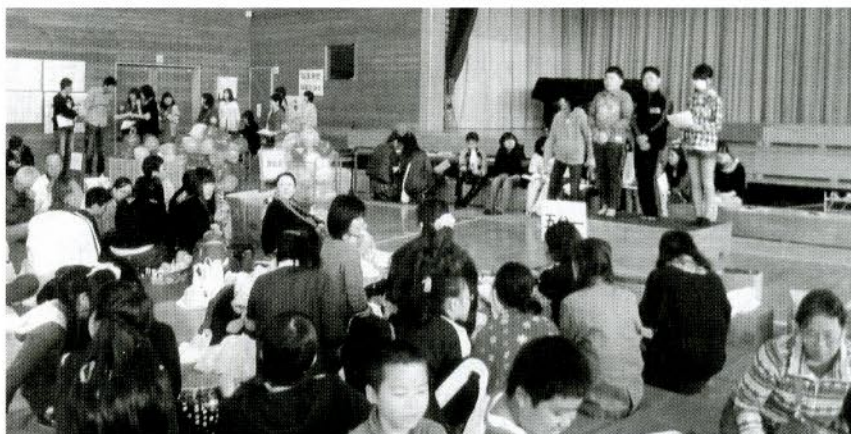
会長会のレクリエーション

まず地区ごとにカレーの準備をしました。子ども達が協力して野菜を切って鍋に入れました。次に小学生子ども会長会の皆さんが考えたレクリエーションを楽しみました。風船テープはがしゲーム・絵を当てるゲーム・よく観察ゲームを行いました。どのゲームもチームワークが大切です。