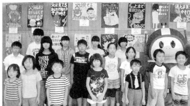
防火・防犯・交通安全ポスター受賞者（敬称略）

引き続き、消防団から「災害記録とポンプ操法」の上映、和田交番から「振り込め詐欺」の寸劇、市交通政策課から「交通安全の腹話術」が披露され、防火・防犯・交通安全の意識を新たにする表彰式となりました。