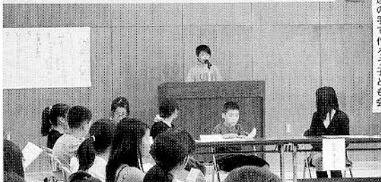
自分達の手で作ろう子ども会