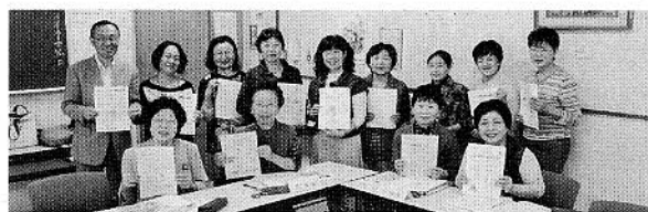
各地区子育て支援部員が地域の子育て支援実施日のチラシを掲げています