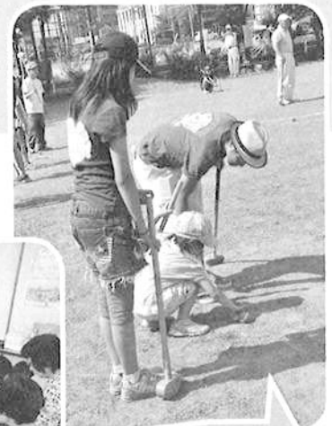
お年寄りとの世代交流事業