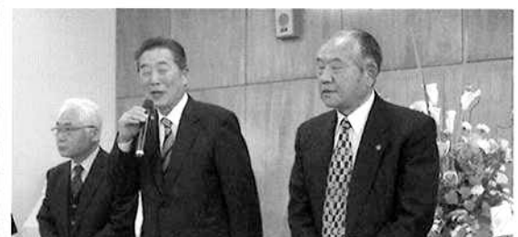
退任役員の皆さん