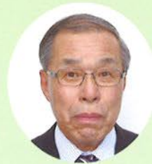
区長 三上 喜伴 川端区