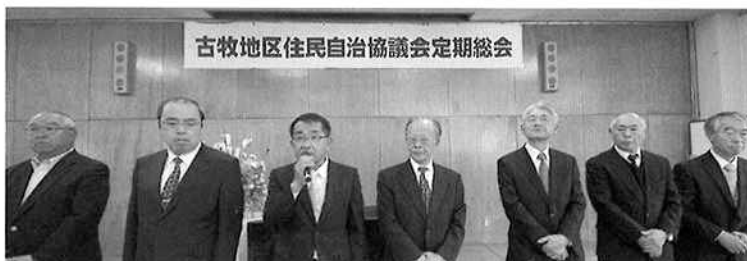
新任役員の皆さん

この承認に伴いまして、会則第7条第3項の組織図（別表）の一部改正も合わせて承認されました。