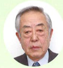
区長 藤澤 博 東和田区